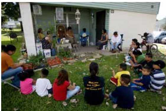
Barn og voksne samlet til bønn og fordypning i Austin, USA.

«O Gud! Opplær disse barn. Disse barn er plantene i din frukthage, blomstene på din eng, rosene i din hage. La ditt regn falle på dem; la virkelighetens sol skinne på dem med din kjærlighet. La din bris forfriske dem så at de kan oppøves, vokse og utvikles og fremstå i den største skjønnhet. Du er giveren. Du er den medlidende.»