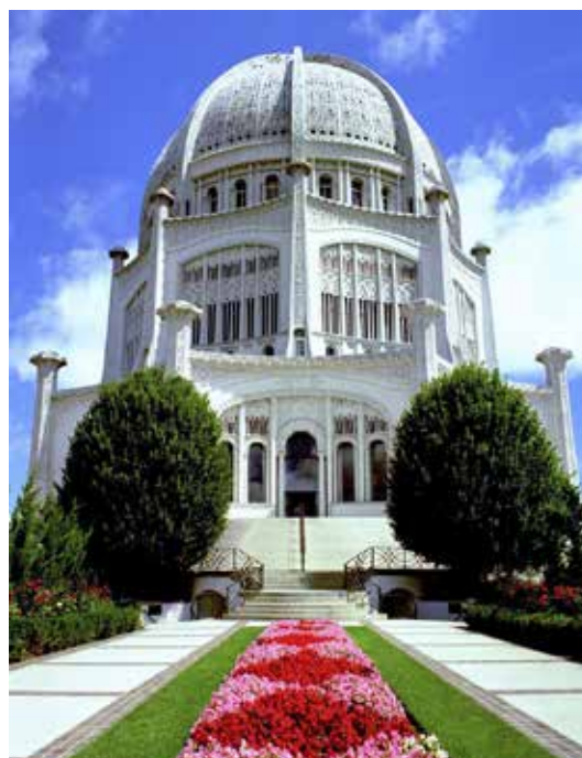
Templet i Willmette i Chicago, USA