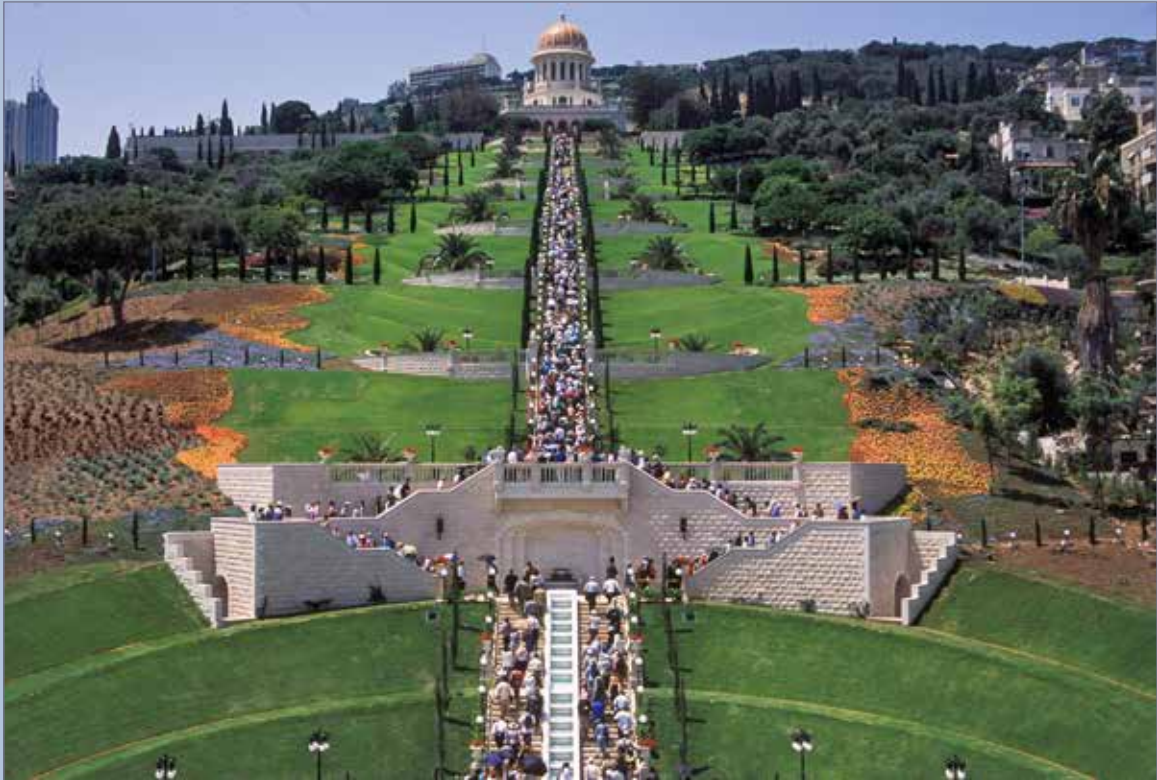
Deltakere fra hele verden vandrer opp Karmelfjellet under åpningen av terrassene til Bábs gravmæle, 23. mai 2001

«Verdensfred er ikke bare mulig, men uunngåelig. Den utgjør neste stadium i denne planetens utvikling»