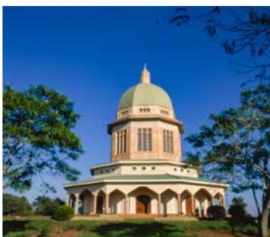
Templet i Kampala, Uganda