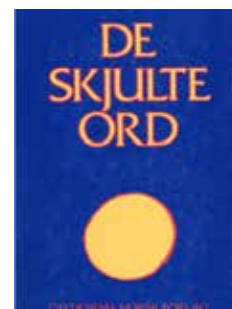
Visdomsord åpenbart av Bahá'u'lláh.

'Abdu'l-Bahás visdom er en samling inspirerende og oppløftende taler, som for det meste ble holdt uformelt og for små forsamlinger under hans besøk i Paris og London i 1912 og 1913.