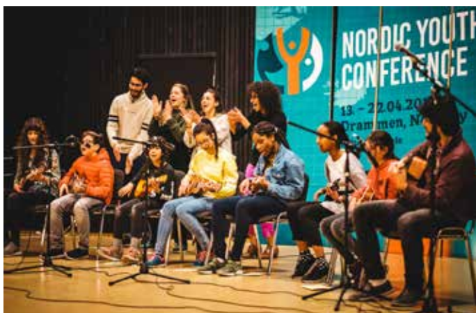
Ungdommer på Nordisk Bahá'í Ungdomskonferanse i Drammen.

Mange lokale bahá'í-samfunn tilbyr bahá'í-inspirerte fritidstilbud for ungdom i alderen 12–15 år. Opplegget tilbys over hele verden og kalles Åndelig styrking av juniorungdom . De er i likhet med barneklassene åpne for alle, uansett bakgrunn, og fokuserer på utviklingen av åndelige egenskaper, intellektuelle ferdigheter og evne til tjeneste for fellesskapets beste. Målet med ungdomsgrupper er å styrke selvbildet og gi ungdommene den kunnskap og de ferdigheter de trenger for å kunne tjene samfunnet og menneskeheten. Ungdommene deltar i rådslagning/konsultasjon, drama, studier av bahá'í-inspirerte tekster, formingsaktiviteter, sport og tjenesteaktiviteter for lokalsamfunnet. Tjenesteaktiviteter kan være alt mulig som juniorungdommene selv velger, for eksempel å plukke søppel, støtte veiledere i barneklasser og til å hjelpe de eldre i nabolaget.