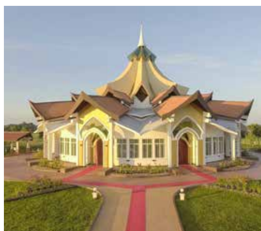
Templet i Battambang, Cambodia