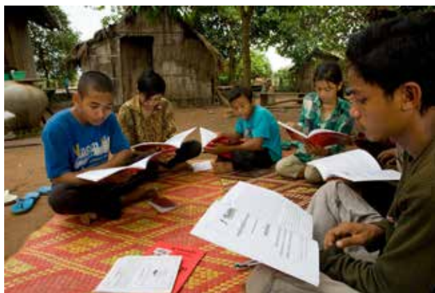
Bahá'í studiesirkel, Fjellhamar i Preah Vihear, Cambodia.

Bahá'í-samfunnet tilbyr også kurs for eldre ungdommer og voksne, åpne for alle. Ett av kursene, «Refleksjoner over åndens liv», handler om åndelig utvikling og praktisk anvendelse av åndelige verdier. Kurset er basert på bahá'í-troens skrifter og tar for seg emner som meningen med livet, sjelens natur, positive verdier og etisk oppførsel, bønnens åndelige dynamikk, perspektiver på liv og død og menneskets forbindelse med Gud . Kursene består hittil av ti hefter som handler om forskjellige emner, og er under utvikling.