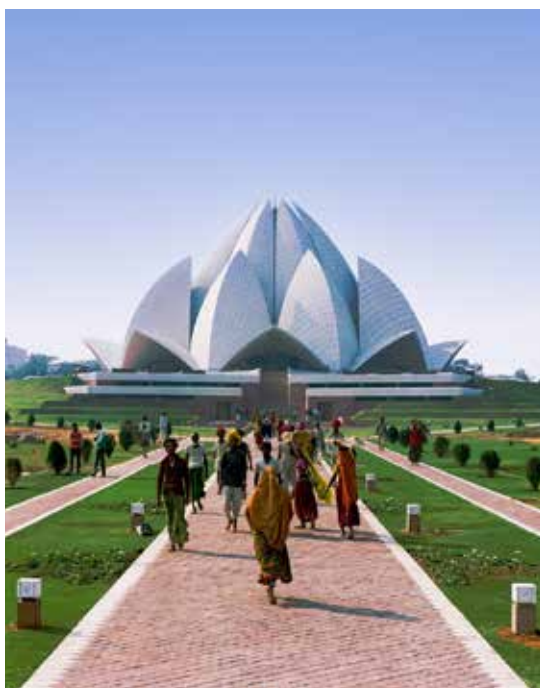
Lotustemplet i New Delhi, India

Nedenfor er eksempler på noen av templene.