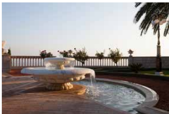
Fontene på en av terrassene til Bábs gravmæle.

Religion bør være årsak til kjærlighet og hengivenhet. Kjærlighet er en sterk kraft.