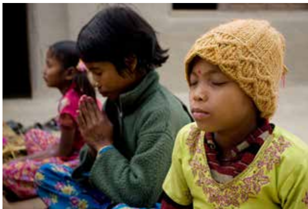
Barn samlet til åndelig samvær i East Kanchanpur, Nepal.

Bønn og meditasjon er viktig for en bahá'í for å kunne utvikle seg som menneske. Bønner skrevet av Báb, Bahá'u'lláh og 'Abdu'l-Bahá inneholder symboler og bilder som hever menneskets ånd mot det guddommelige og det mystiske. Ånden blir opplyst, utvikler seg og blir styrket, og mennesket får kjennskap til ting det ikke visste fra før. Gjennom bønn og meditasjon kan man finne løsninger på