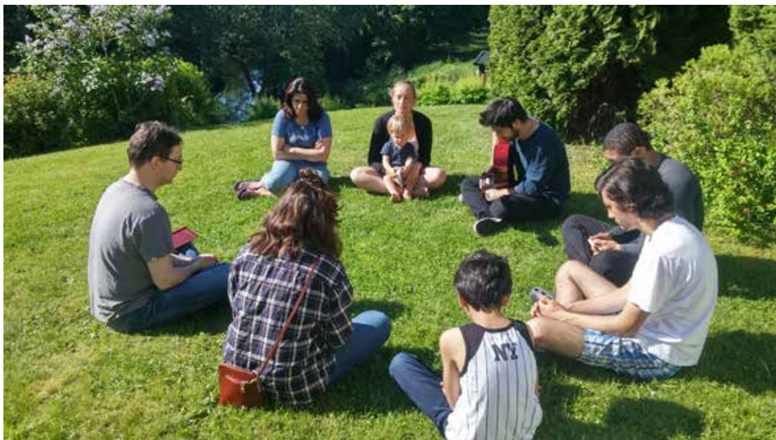
Et utendørs tilbedelsesmøte på Fjellhamar.

En annen vanlig aktivitet i lokale bahá'í-samfunn er regelmessige sammenkomster med bønn, meditasjon og skriftlesning, som ofte holdes hjemme hos bahá'ier. Sammenkomstene foregår uten bestemte ritualer. Deltakerne leser for eksempel skrifter fra forskjellige religioner for å få inspirasjon fra Guds ord. Tilbedelsesmøtene er åpne for alle, uansett livssyn og bakgrunn.