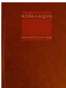
Kitáb-i-Aqdas er hovedboken i Bahá'u'lláhs lære.

'Abdu'l-Bahá skrev flere forklaringer til Bahá'u'lláhs verk. Originalspråkene til bahá'í-troens hellige skrifter er persisk og arabisk, men de er nå oversatt til mange andre språk.