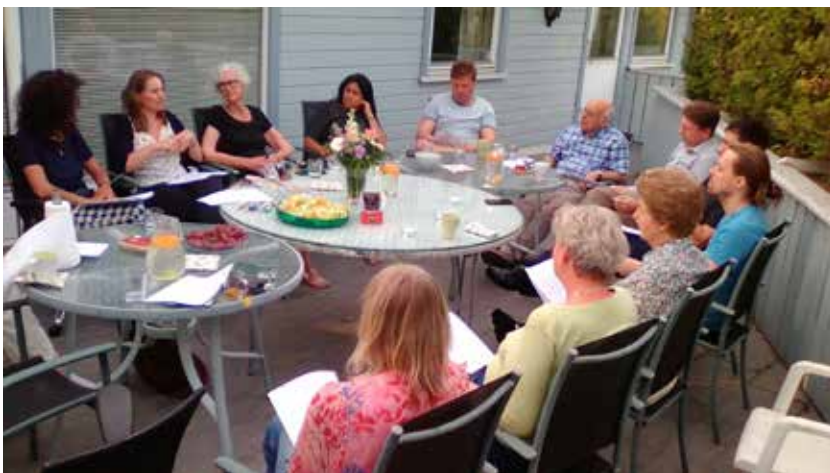
Et rådslagningsmøte på baháí-senteret i Oslo.

Baháí-troen ser på rådslagning som et fundament for en ny verdensorden. Rådslagning er et viktig verktøy for et godt samarbeid. Alle må respektere hverandre og lære å arbeide sammen i harmoni for et felles ideal. I en rådslagning skal alle få anledning til å uttrykke sin mening. Man prøver å oppnå en løsning som alle kan enes om. Hvis man ikke blir helt enige i en sak, tar man en avstemning. Et prinsipp i baháí-troen er at når beslutningen er tatt, følger alle lojalt opp vedtaket med tanke på å ivareta enhet.