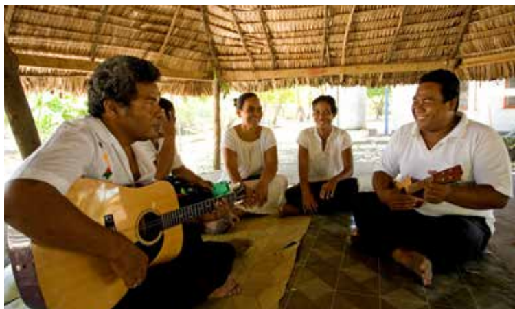
En sammenkomst med bønn og sang i South Tarawa, Kiribati.

Der er ingen annen Gud enn deg, hjelperen i fare, den selvbestående.» – Bahá'u'lláh